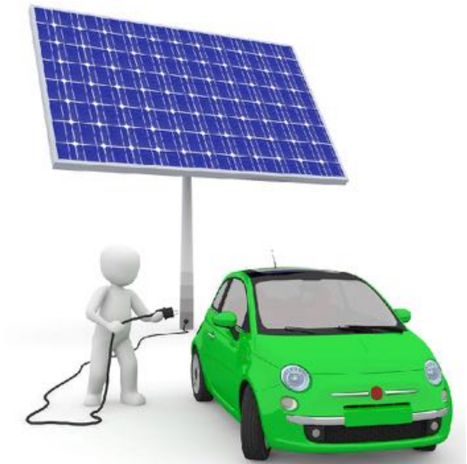
Erneuerbare Energien & Mobilität