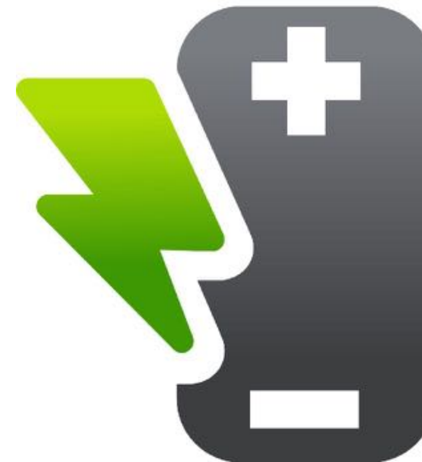
Speicher & Ladeinfrastruktur