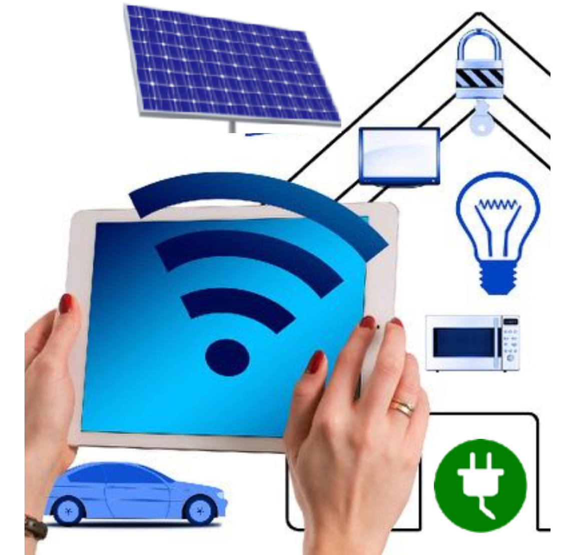
Smart Home & Energieplus Häuser